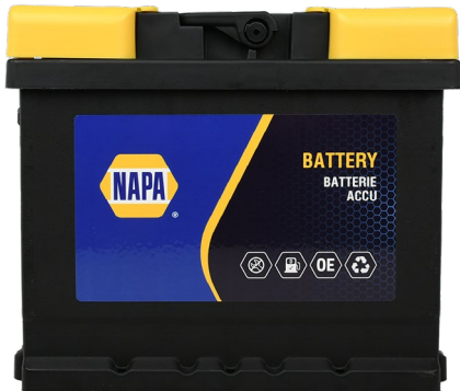
Abb. zeigt 063N