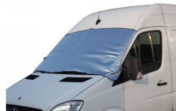
Abb. zeigt 18241