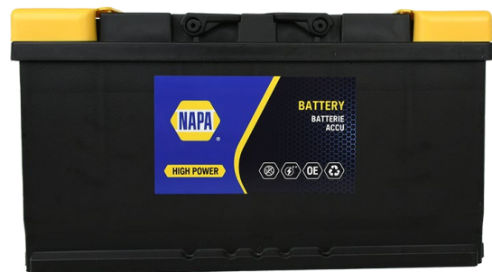
Abb. zeigt 019NP