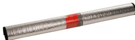
Abb. zeigt 18240